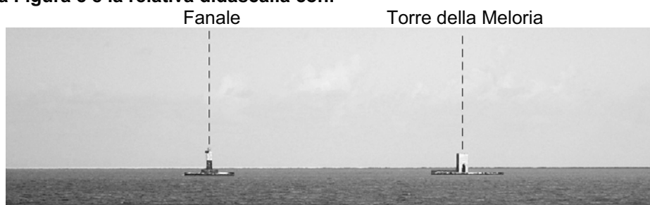
Figura 8 - Fanale sull'estremità S delle secche della Meloria e Torre della Meloria da E (2005).